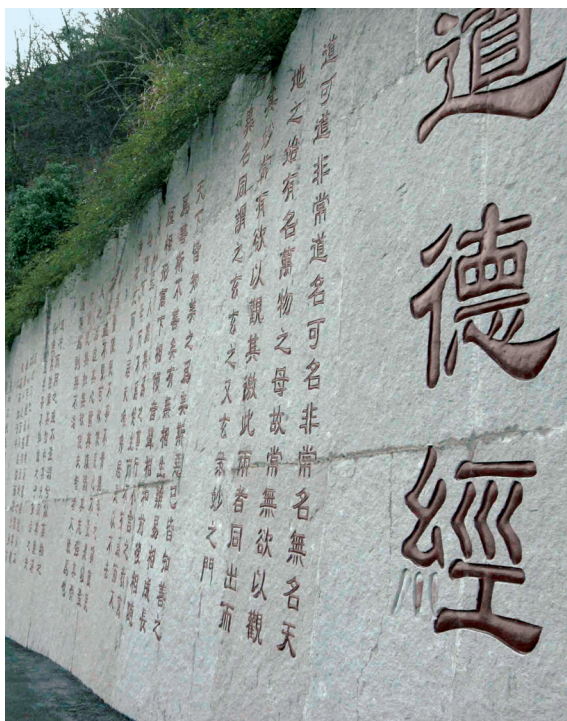
《道德經》崖刻，攝於浙江淳安千島湖。