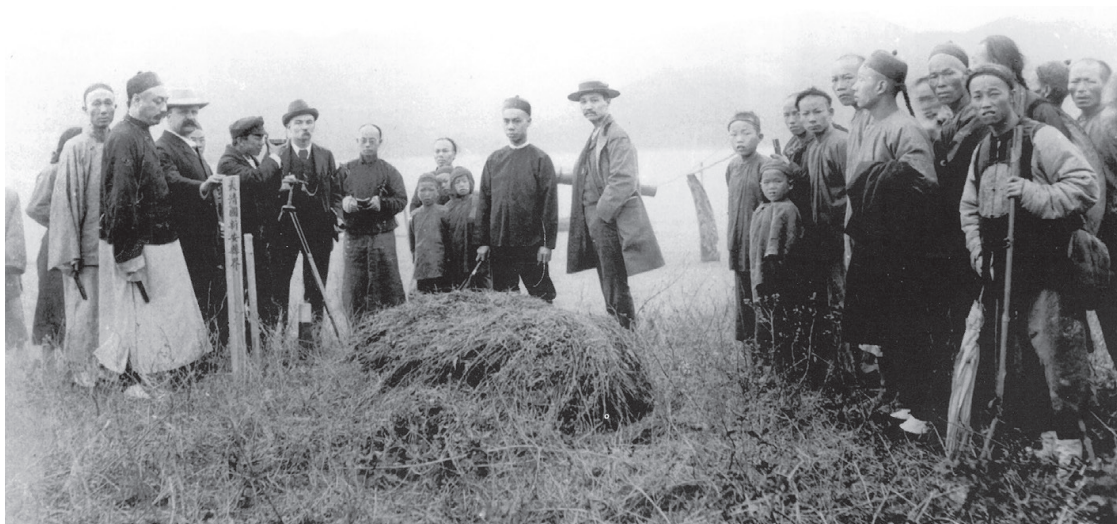
1899年3月5日，清朝官員與英國官員共同勘界，從此寶安縣約三分之二土地劃為英國租界地，謂之新界。