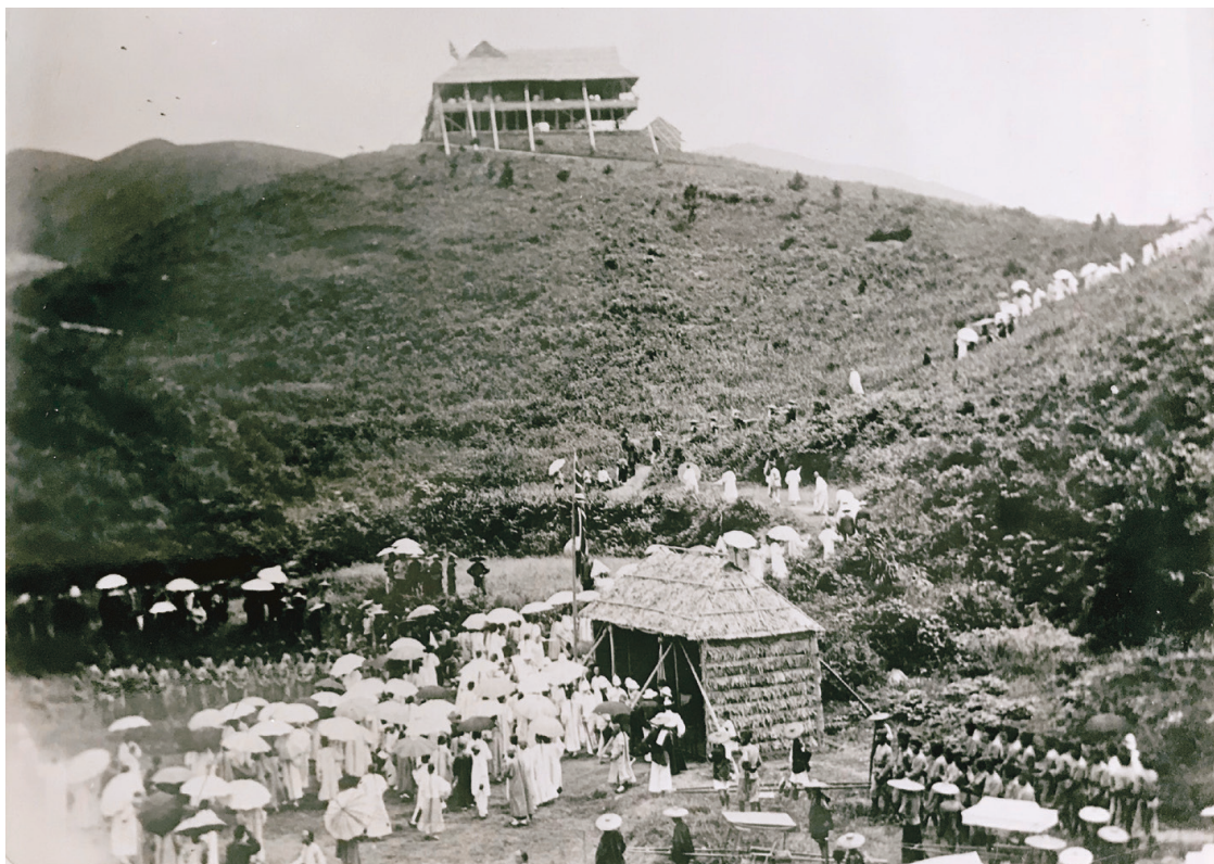
1899年8月2日，來自新界各鄉的紳耆，聽完港督卜力的演說後，陸續散去。他們穿着中式傳統長衫，心中應是別有惆悵。