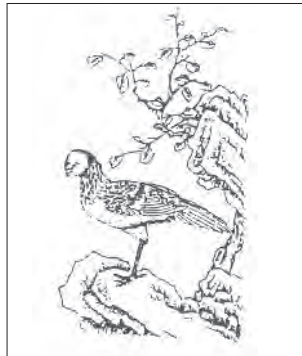
人面畢方 [清]《禽蟲典》圖本