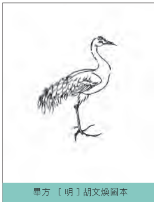
畢方 [明]胡文煥圖本